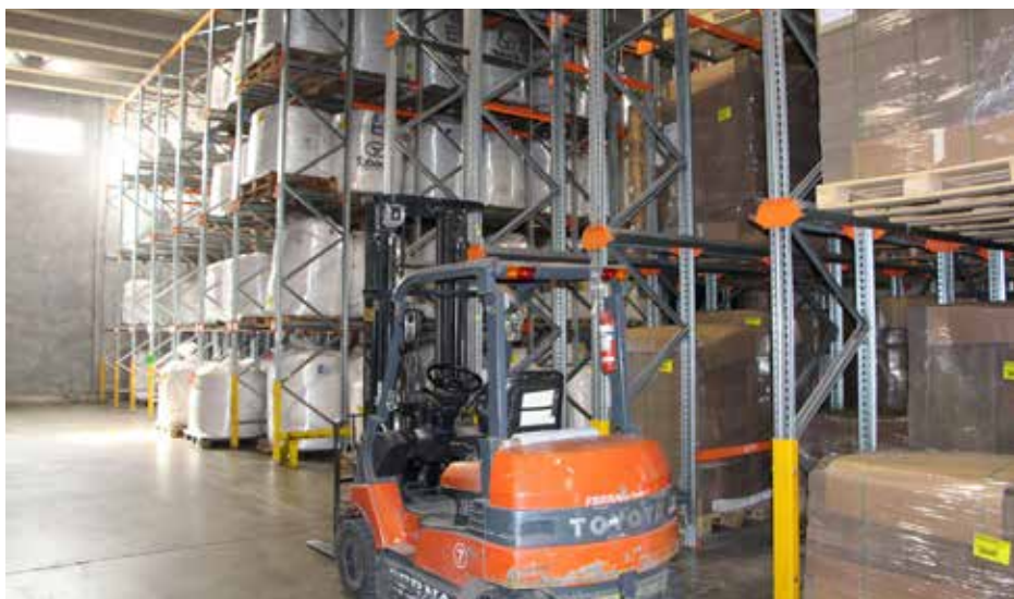
Depósito de materias primas, estiba en estanterías metálicas.