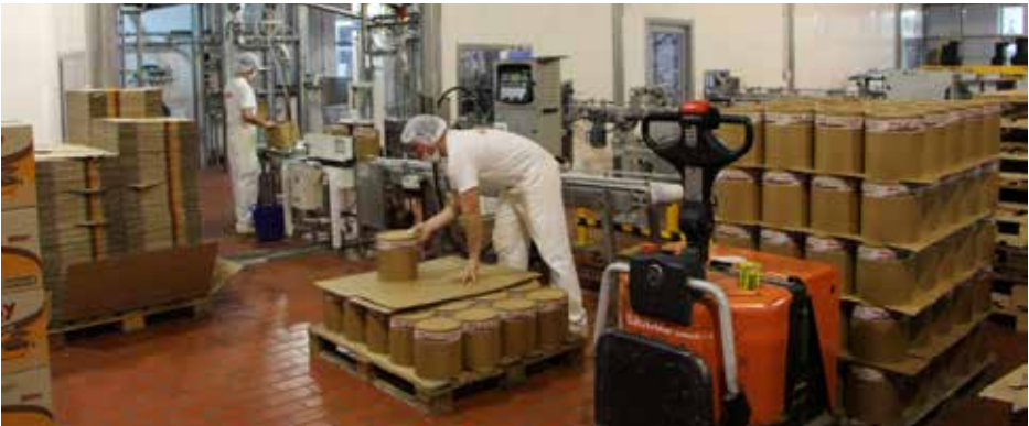
Sector de paletizado.

giro, freno; bocina y dispositivo acústico luminoso de retroceso; espejos retrovisores; frenos de estacionamiento; extintor acorde al riesgo existente;