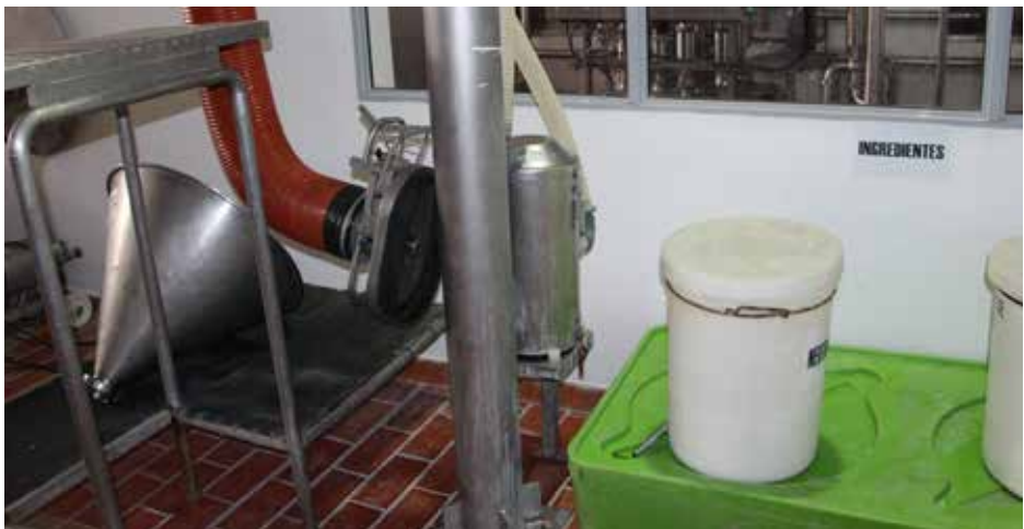
Agregado manual de ingredientes en tolvas de descarga.

La leche es transportada a tanques de mezcla donde se le agregan los ingredientes necesarios para la elaboración del dulce: azúcar, aromatizante de vainilla, bicarbonato de sodio (como neutralizante), jarabe de glucosa (proporciona brillo y evita que se cristalice la lactosa) y conservantes, entre otros.