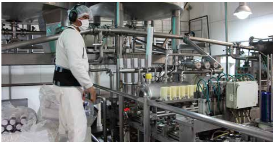
Máquina envasadora de dulce de leche.

De acuerdo a la tecnología utilizada, este proceso puede ser manual, automático o semi-automático: