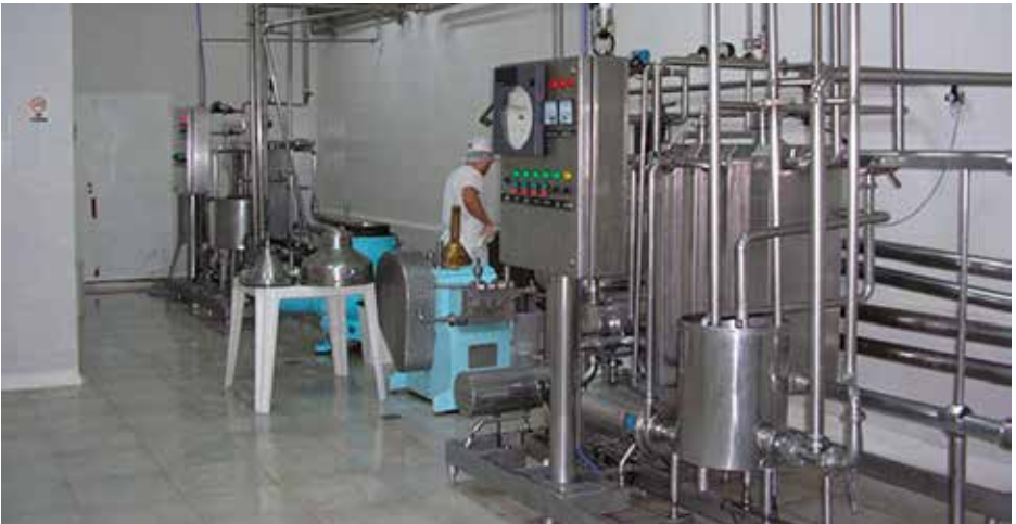
Equipo de Pasteurización.

63/65°C durante 30 minutos o de 65/68°C durante 10 minutos y luego se enfría a 32/36°C. Por lo general, esta pasteurización se realiza en la misma paila de elaboración.