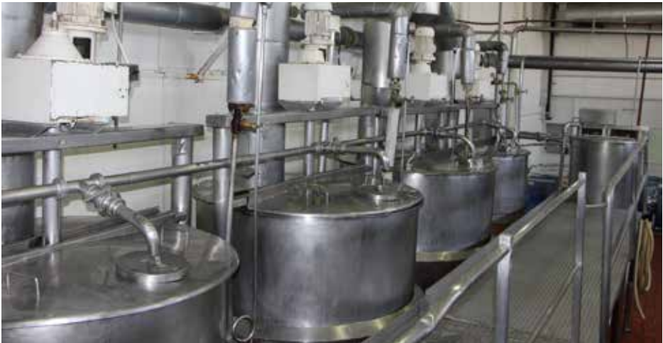
Sector pails, boca de carga.

A medida que avanza la concentración (entre 2 y 4 horas, dependiendo del tipo de dulce de leche a elaborar) se va acentuando el color hasta alcanzar el punto deseado.