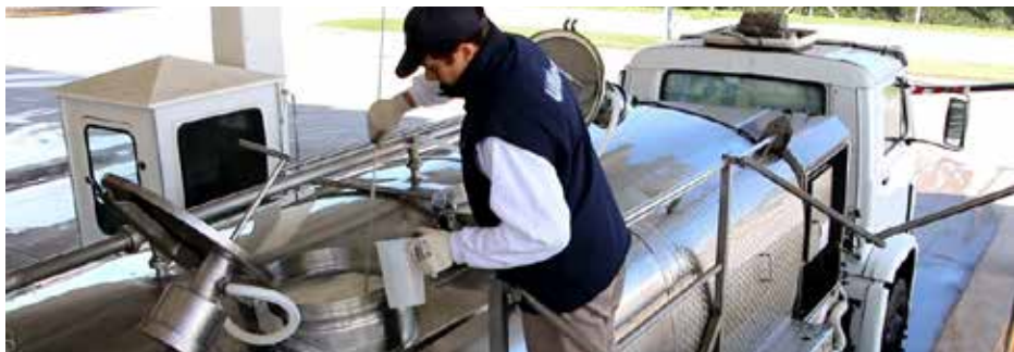
Toma de muestra de leche en la planta.

¿Cómo se obtiene la muestra en el tambo? El conductor toma una muestra de leche cruda, en un recipiente térmico, en cada uno de los tambos donde realiza la recolección. En caso de que los resultados de laboratorio de la muestra tomada por la planta se encuentren fuera de los parámetros requeridos, se procederá a realizar el análisis de estas muestras que el conductor lleva en la cabina. En caso contrario, no se analizan.