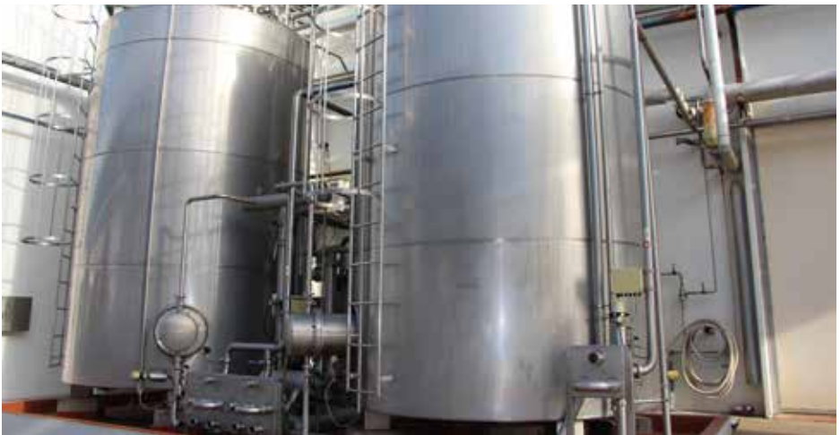
Tanques de almacenamiento de leche cruda.

El operario recolecta una muestra de leche a la que se le realizarán los siguientes análisis de laboratorio: antibióticos, acidez, composición, pruebas sensoriales (aroma, color, entre otras). Para ello, dependiendo de las características del camión cisterna, el operario se sube al vehículo para alcanzar las bocas superiores o escotillas y en otros casos, la toma se realiza desde el grifo (válvula). Los resultados de estos controles permiten decidir si se realiza la descarga de la materia prima en tanques/silos de almacenamiento.