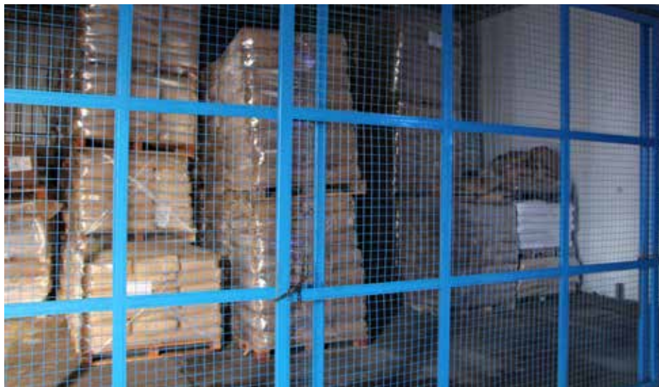
Depósito de materias primas. Fuente: SRT (2016)