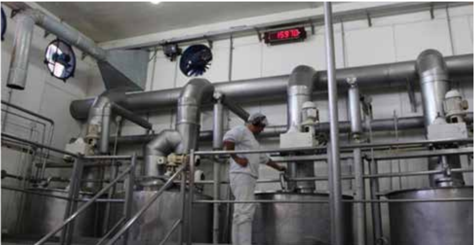
Sector de encajonado y empaquetado.

El empaquetado puede realizarse de diferentes maneras, en función del peso y tipo de envases.