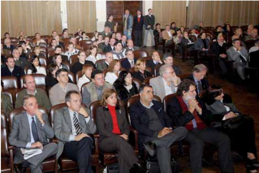
Imágenes del público asistente al Paraninfo de la Universidad Nacional del Litoral