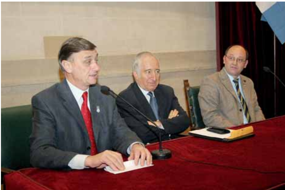
Hermes Binner , Gobernador de Santa Fe, inaugura la conferencia magistral